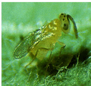
زنبور پارازیتوئید Eretmocerus californicus