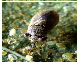
فعالیت سن Geocoris punctipes روی مگس سفید

قهوه ایی می گردد. شفیبه در حدود ۱ میلی متر، بیضی شکل و کمی محدب، حلقه و آخرشکم منتهی به دو