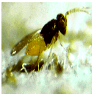
زنبور پارازیتوئید Encarsia formosa