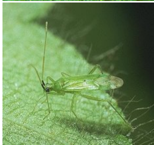
سن Macrolophus caliginosus (شکارگر لارو و تخم های مگس سفید)