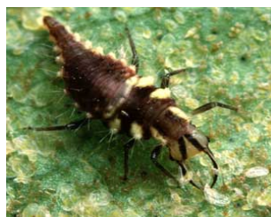
فعالیت لاروبالتوری Chrysoperla sp. روی مگس سفید